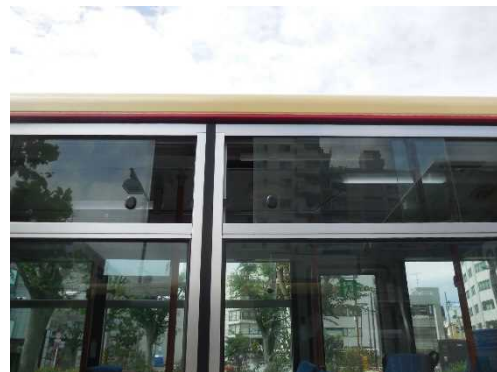
窓開け車内換気の様子(路線バス)