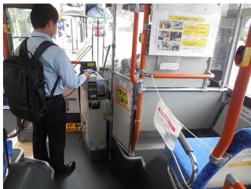
飛沫防止シート、キャッシュレス決済、 1列目座席制限の様子(路線バス)