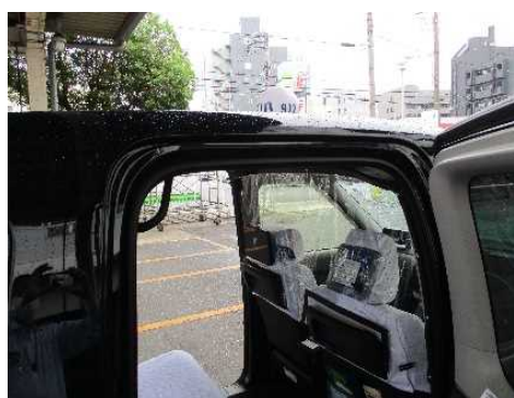
飛沫防止シートの様子