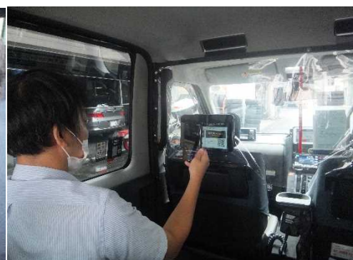
キャッシュレス決済の様子

※ なお、タクシーは、エアコン稼働下でも 約1分で空気が入れ替わります ((一社)東京ハイヤー・タクシー協会調べ)。詳細は、以下をご参照ください。