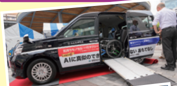
ユニバーサルデザインタクシー車両 トヨタ「ジャパンタクシー」