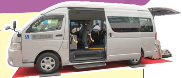
福祉車両（リフト付き） トヨタ「ハイエース」