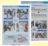
交通事故防止 委員会